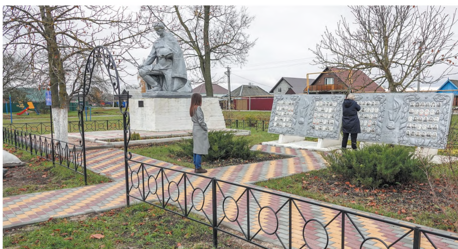
Благоустроенная территория у братской могилы в селе Холки

Ещё одно излюбленное место для детей появилось в Холках. Для маленьких сельчан созданы условия для физического развития, полезного и безопасного от-