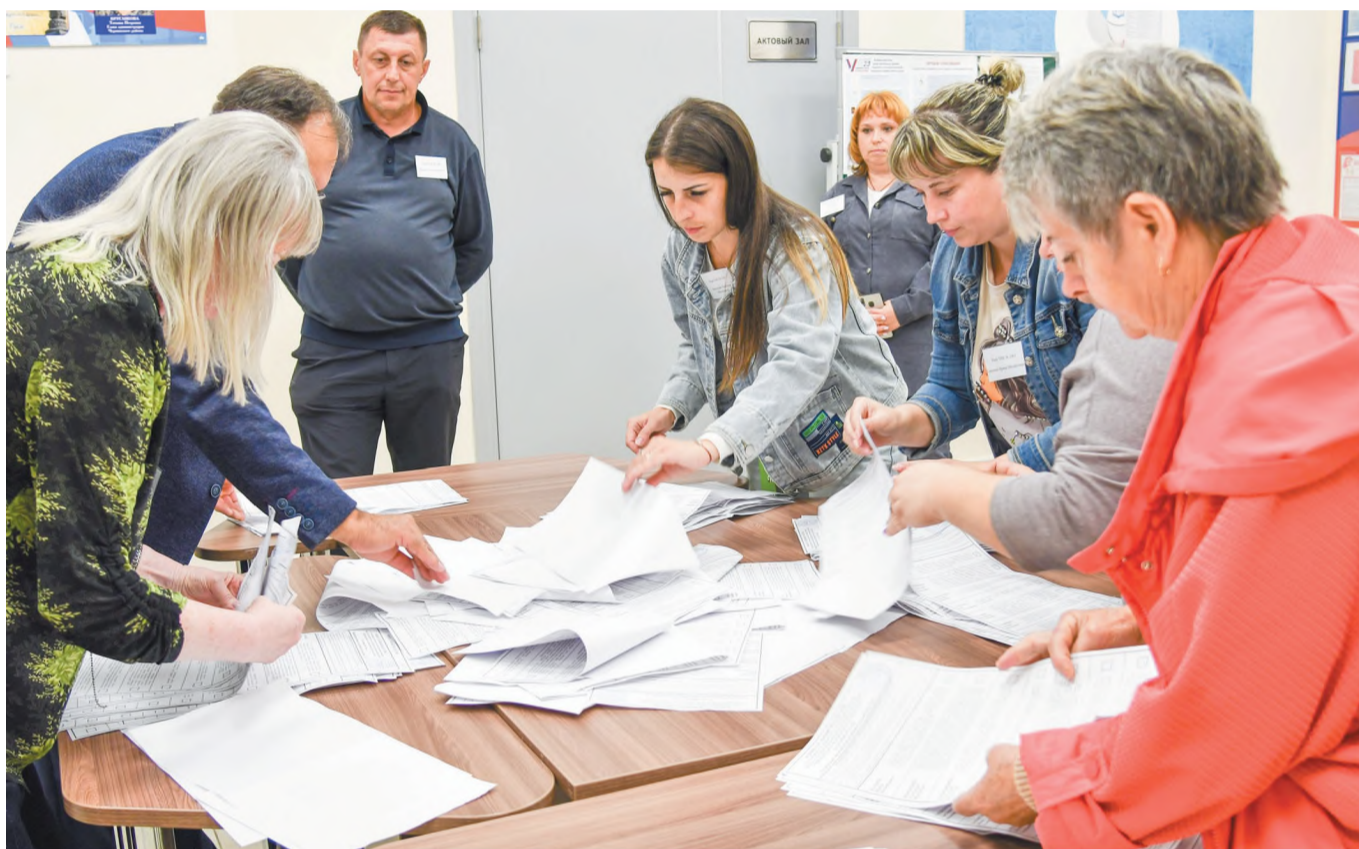
Подсчёт голосов на участке № 1063

Трёхдневная выборная кампания завершилась в Белгородской области. Жители муниципалитета голосовали за депутатов местных представительных органов городского и сельских поселений пятого созыва.